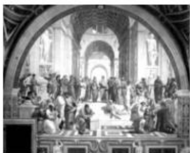
图二:拉斐尔《雅典学院》

14-17 世纪，在欧洲画坛上，透视法转入蓬勃发展时期。在前人光学研究成果和艺术家实践经验基础上，意大利的阿尔贝蒂把定点透视理论纳入“绘画三要素”。随后越来越多的画作追求呈现日常生活的真实感和自然感，融透视表现方法与人文主义精神为一体。（见图二）